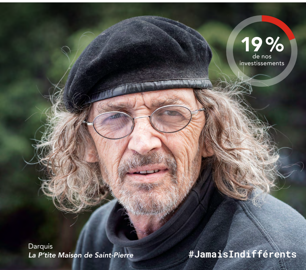
Darquis La P'tite Maison de Saint-Pierre

Darquis s'est isolé longtemps dans son sous-sol avec trop peu de moyens pour bien se nourrir avant de trouver une nouvelle famille dans l'un des 350 organismes soutenus par Centraide.