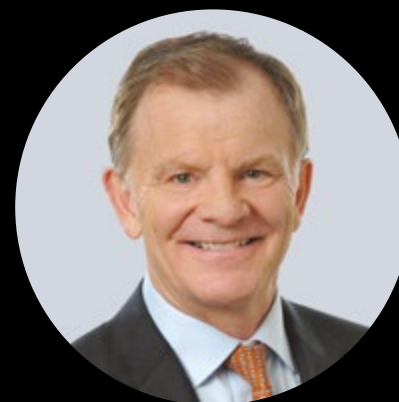
Président du Cercle des Grands donateurs