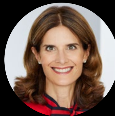
Présidente honoraire du Cercle des Grands donateurs

Président et chef de la direction, Metro inc.